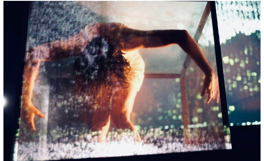
Images de la création en plein air au jardin de l'hôtel de ville de Cognac, en ouverture du festival Coup de Chauffe, le 6 septembre 2019