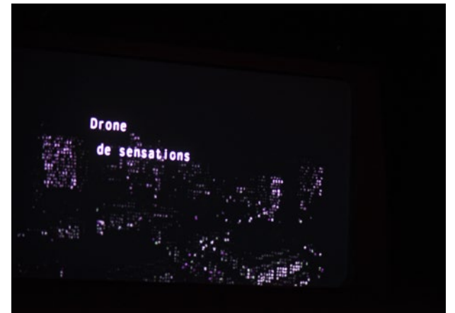
Images de l'écriture interactive, lors de l'étape de création à Mains d'Œuvres, le 11 avril 2018.